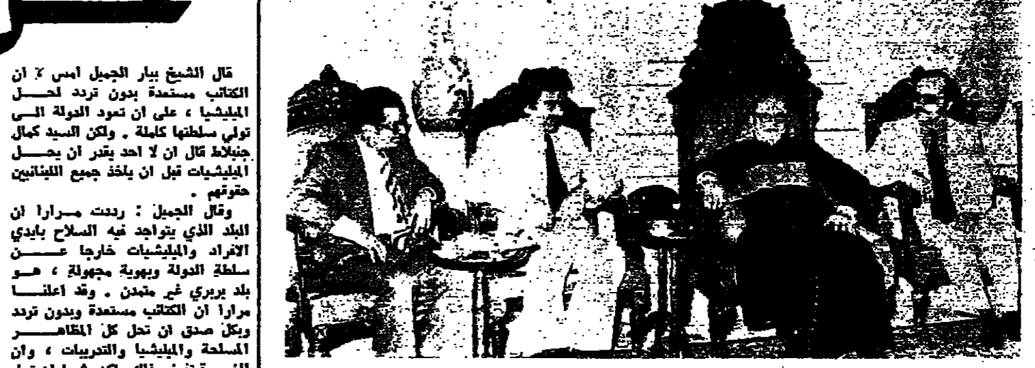
قام صباح امس وفد من اللجنة المركزية للحزب الشيوعي اللبناني مؤلف من السيدات جورج حياوي، وكريم مروه، وهوريس نورا، وزيارة الى غبطة البطريق مار بولس بطريرك خريش لتقديم التهنئة اليه بمناسبة تخليده ولشكره على المواقف الطيبة التي اتخذها أثناء الأحداث الأخيرة التي يمر بها لبنان. وفي الصورة يسار البطريق خريش متوسطا الورد

لكن البعض يميل الى الضحك بالنسبة الى الموضوع، وهو يقول ان الإشارة الجيدة الى اقتراب الاتفاق، يفترض ان تكون وصول نائب الرئيس المصري السيد حسني مبارك الى دمشق لاطلاق الرئيس الأسد على التفصيل في شكلها الآخر. ذلك ان الرئيس السادات يفضل عادة التخفيف من رسائله والتصاته العربية حين تكون المفاوضات في المراحل الصعبة او المجهولة المصير. وقد حدث ذلك خلال مفاوضات اسوان في آذار الماضي، وهو ما يحدث الآن. وان كان هناك من يعبر زيارة رئيس مجلس الشعب المصري الى دمشق إشارة في هذا المجال، كذلك فان زيارة الامير فهد ولي العهد السوري لسوريا لها عنوان اساسي هو القوات وبتعاون آخر بمناقشة اللبنانيين العربي ودولتي المرحلة الاساسيتين.